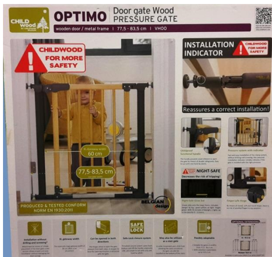
OPTIMO réf. VH00, EAN 5420007123529 OPTIMO White réf. VHOOW, EAN 5420007132439