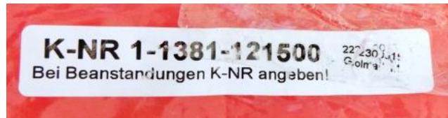
« Schwenk Türschutzgitter », réf. 2732, lot 121500

Tous les produits non-conformes ont fait l'objet de mesures d'interdictions de vente, de retraits et de rappels par l'ILNAS. Certaines de ces barrières étaient encore commercialisées en décembre 2016 au Luxembourg. Etant donné le risque grave pour la santé et la sécurité, les produits concernés ont également été notifiés à la Commission européenne par le biais du système communautaire d'échange rapide d'informations (RAPEX). Cette notification permet aux autres Etats membres de l'Union européenne de prendre les mesures nécessaires pour interdire la mise sur le marché de ces produits sur leur territoire national.