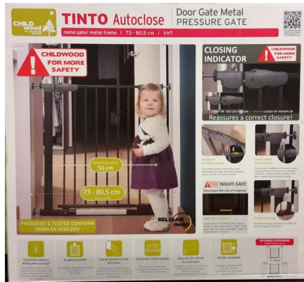
réf. VHT, EAN 5420007124021