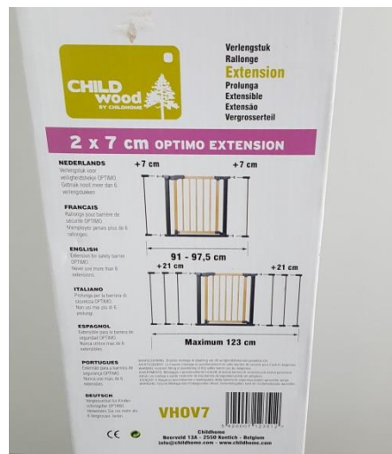
Extension réf. VHOV7, EAN 5420007123512