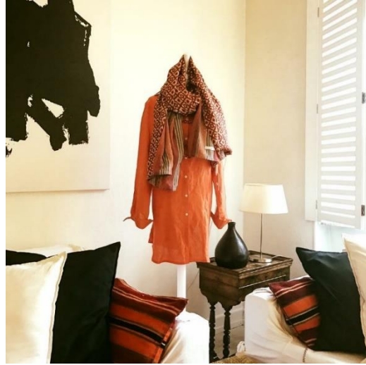
Diversity – écharpes