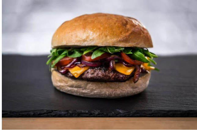
FoodRiders – cuisine américaine