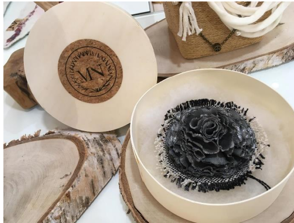
Merci Nature – vêtements et accessoires