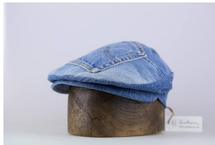
Risaïkourou – accessoires