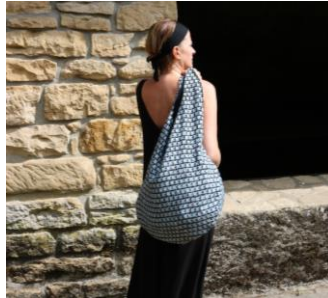
Sopilipili – vêtements et accessoires