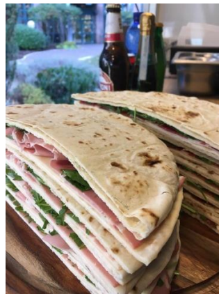
Amore al dente – cuisine italienne