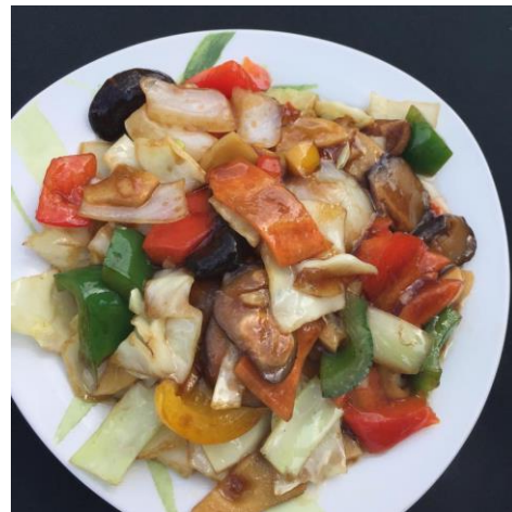
Wok me up – cuisine asiatique