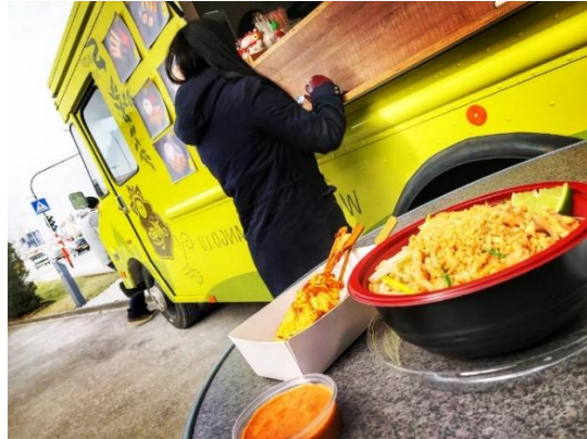
Green Mango – cuisine thaï