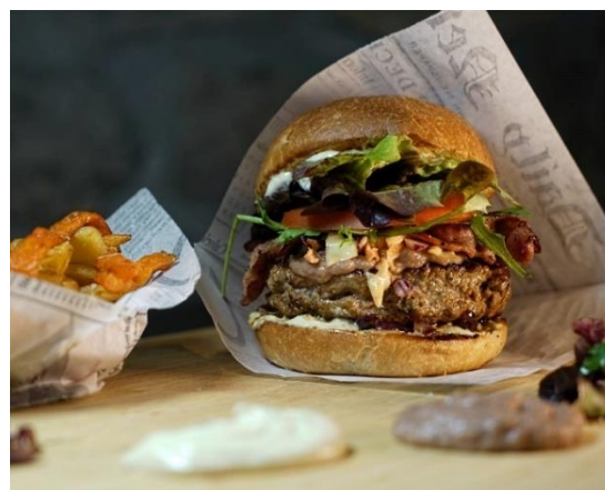
Miller's Diner on Wheels – cuisine américaine