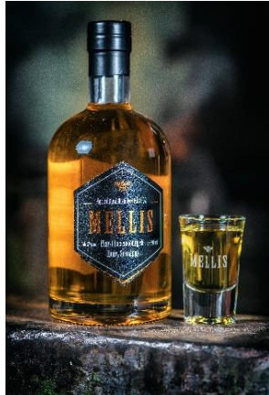
Mellis – eaux de vie