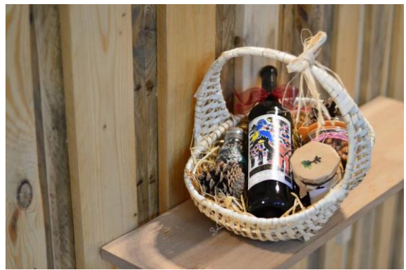
Ouni – magasin sans emballage