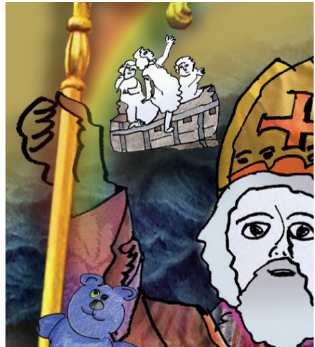
Illustration: Fernand Urhausen, aus dem Buch „Vu Klacken, Klibberen a Kleeschen“

(Aarbechtsgrupp Kannerbicher vun der ErwuesseBildung).