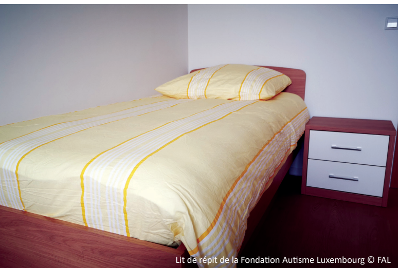
Lit de répit de la Fondation Autisme Luxembourg

Dir musst verstoen, wann een ee Kand mat Autismus an nach een anert Kand ouni