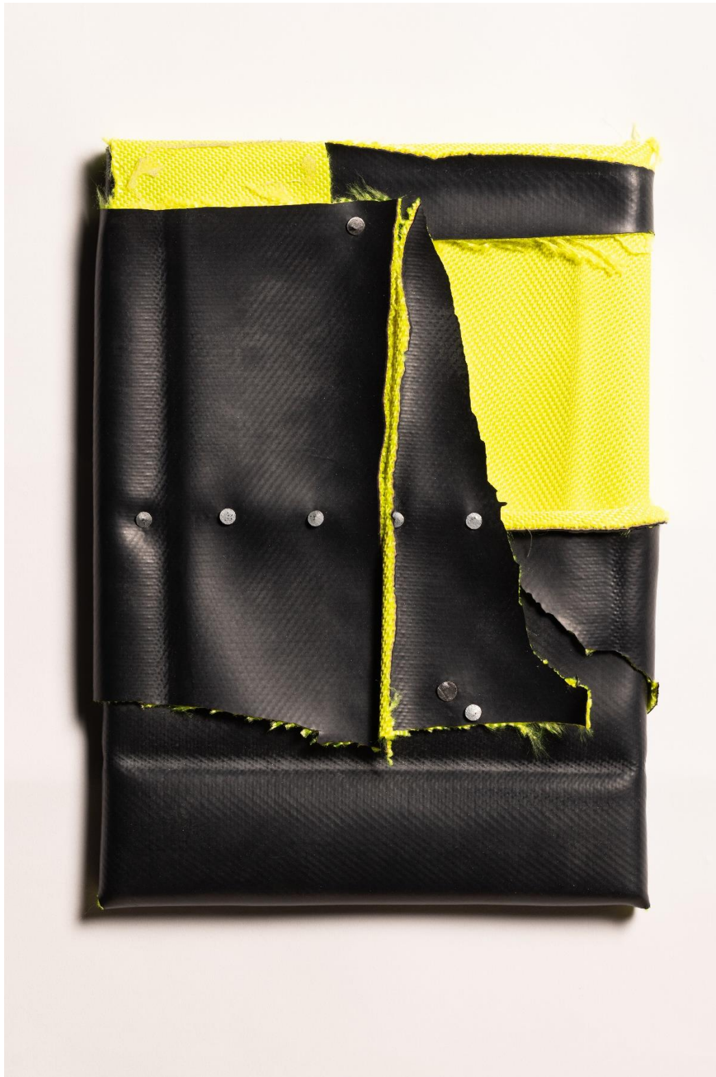
« my motorcycle VII », rubber, nails, glue, 35 x 25 cm