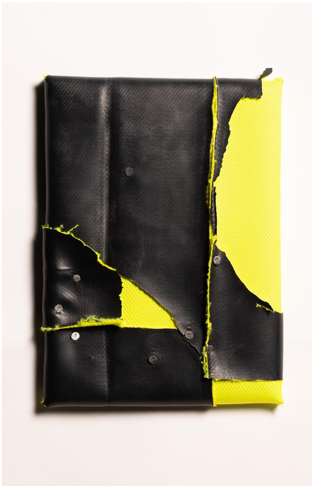
« my motorcycle XIII », rubber, nails, glue, 35 x 25 cm