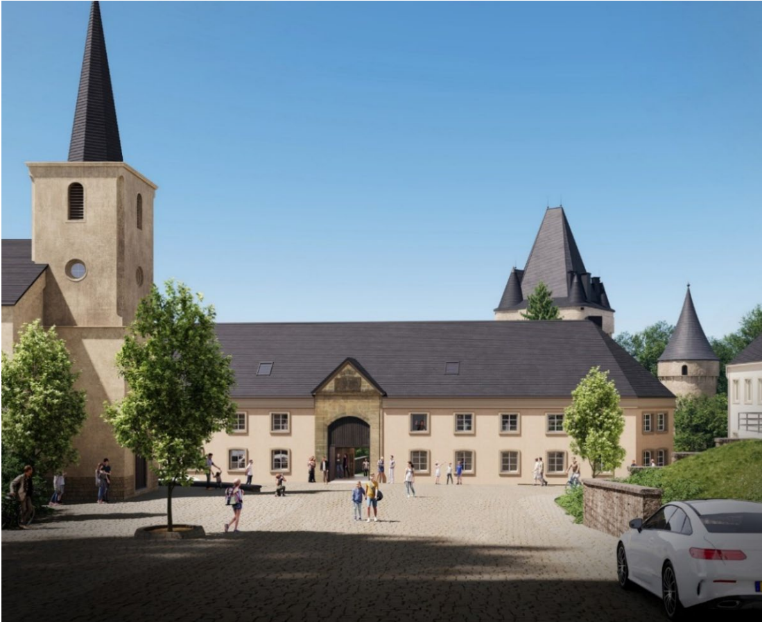
Vue place centrale