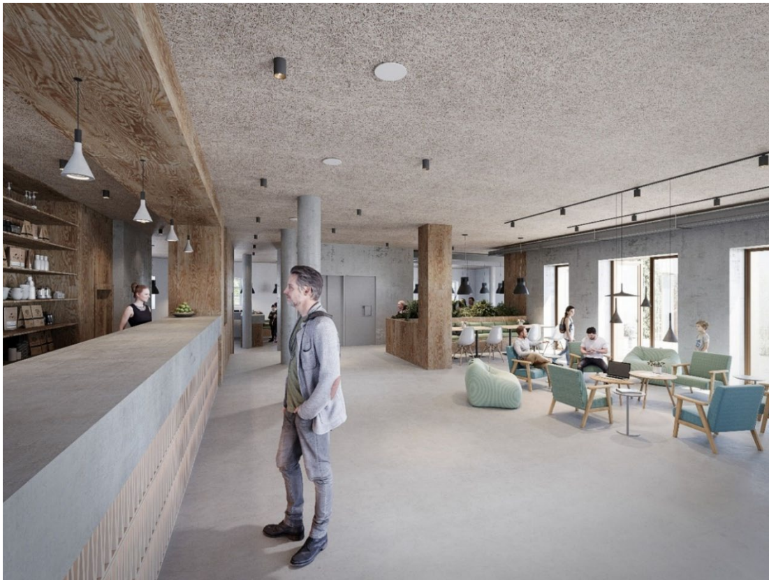
Vue accueil auberge